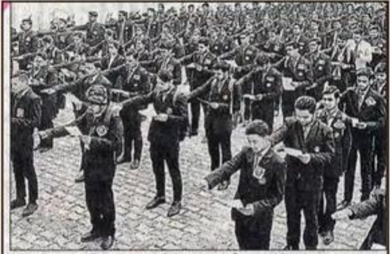
टिफ्ट में मत्तदाता दिवस पर शत प्रतिशत मतदान की शपथ लेते बच्चे।