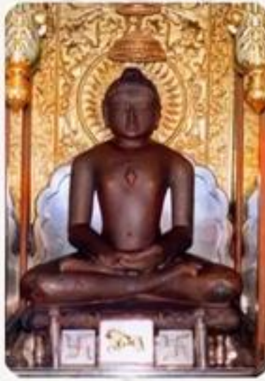
Our Guiding Values