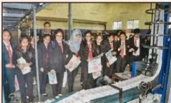
टीमिट के छात्रों ने टिपिट के पत्र-पत्रिकाओं में जाकर अपने बी.बी.सी. की जांच की।

Participating Students: B.Com.(H) Final Year