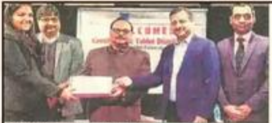
दण्डित में टेकलेट वितरण करती एडीएम सिटी।

Participating Students: MBA-C First Year