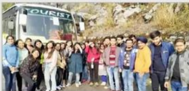
समूह ने नैनीताल की मसाले के डिप्टी को समझने के लिये कुछ केडिल

मुरादाबाद (विधान केसरी)। टिमिट के बी.कॉम. अंतिम वर्ष के छात्र-छात्राओं ने नैनीताल में शैक्षणिक भ्रमण किया। सभी विद्यार्थियों ने छोटे-छोटे समूह बनाकर नैनीताल के विभिन्न पर्यटक स्थलों में जाकर वहाँ के बारे में जानकारी एकत्रित की और समझा कि कैसे पर्यटन एक राज्य के आर्थिक तरक्की का साधन बनता है। यह विद्यार्थी कॉलेज के दूरारे छात्र-छात्राओं को अपने अनुभवों से अवगत करायेगे, जिससे उनका भी ज्ञानवर्धन हो सकेगा। इसी के साथ साथ कुछ विद्यार्थियों के