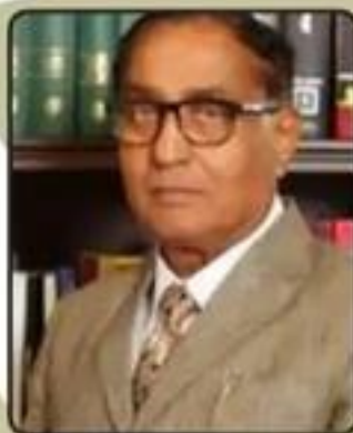
Shri Suresh Jain Hon'ble Chancellor