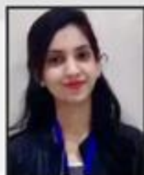
Nida Bi Creative Functional Art