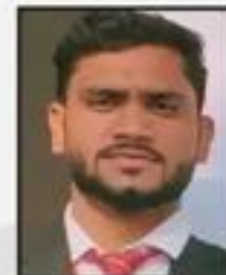
Paras Singh Shriram General Insurance Co. Ltd.