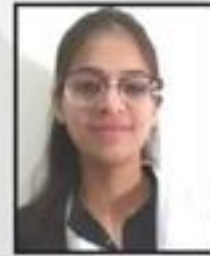
Vidushi Shukla Wealth Clinic Pvt. Ltd.