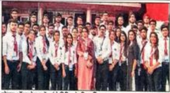
नोएडा ऑटम फेयर में पहुंचे टिमिट के विद्यार्थी।