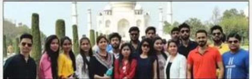
Excursion Tour to "Taj Mahal, Agra"