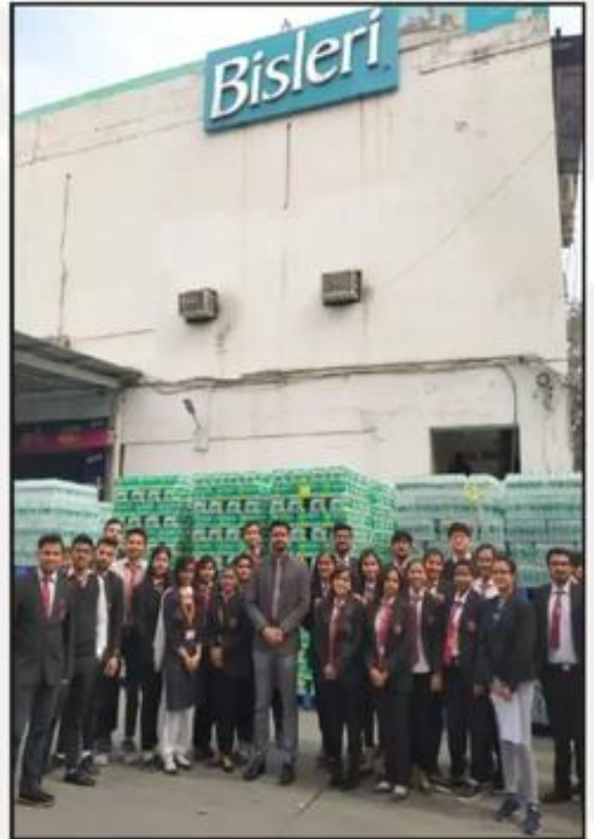
Industrial Visit to Bisleri International Pvt. Limited, Delhi