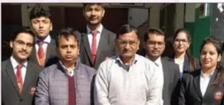
Recruitment Drive of HDFC AMC