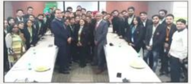
Industrial Visit - Safexpress Pvt. Ltd.