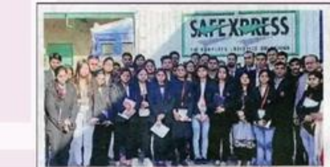
जयकान न टिफिट के एमबीए के विद्यार्थी • लेट-डिस्कल