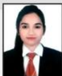
Parul Tishawer Wealth Clinic Pvt. Ltd.