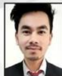
Asidul Ali Wealth Clinic Pvt. Ltd.