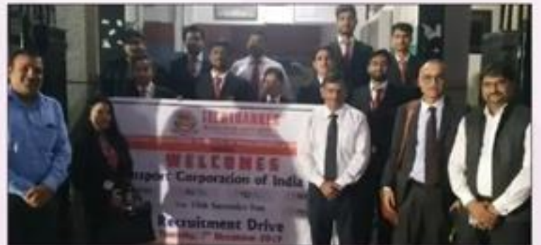
Recruitment Drive of Transport Corporation of India Ltd.