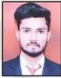
Mohd. Akmal Wealth Clinic Pvt. Ltd.