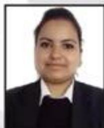
Devanshi Paisal Wealth Clinic Pvt. Ltd.