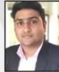
Hasham Ali Khan Kisan Cement & Iron Stores