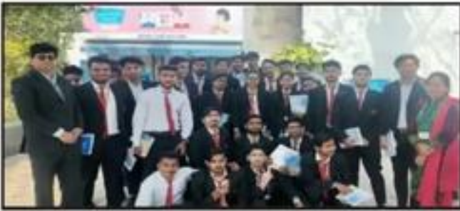
Industrial Visit to "Mother Dairy", Delhi