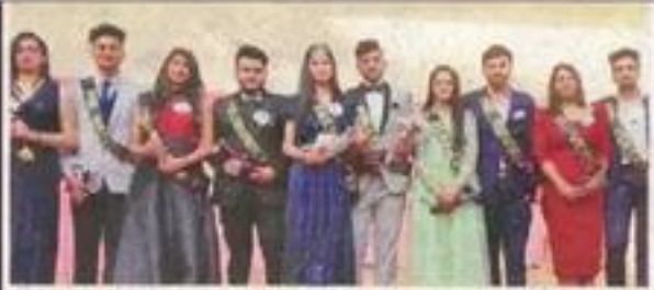
टिमिट में प्रेशर पार्टी में विभिन्न डिपार्टमेंटों से नवज्ये गुरु छात्र-छात्राएं।