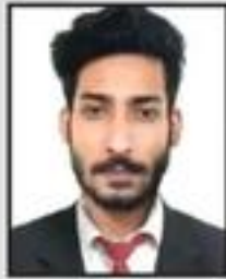
Shazeb Khan Wealth Clinic Pvt. Ltd.