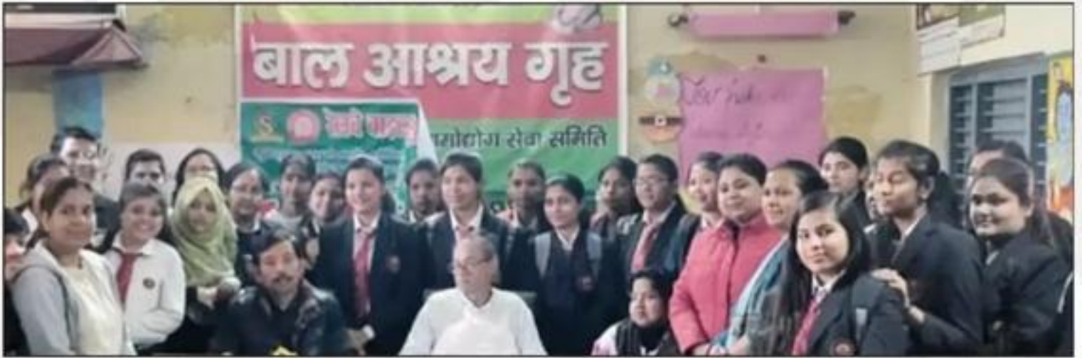
Holi Milan at "Baal Ashram"