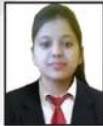
Warisha Himalya Enterprises