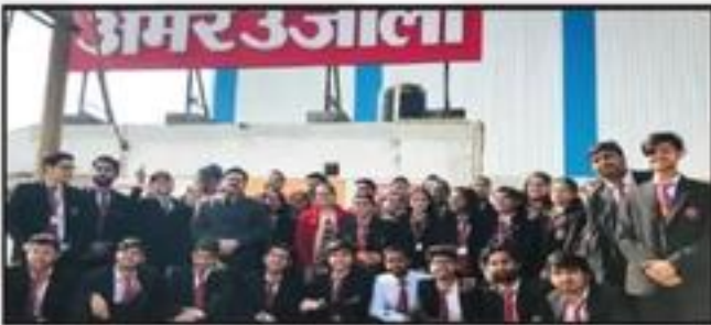
Industrial Visit - Amar Ujala Publication Ltd., Moradabad