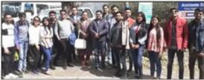
Excursion Tour to "Nainital"