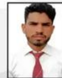
Mohd. Javed TMU Hospital