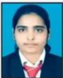
Sualeha TMU Hospital