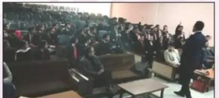
Recruitment Drive of F13 Technologies