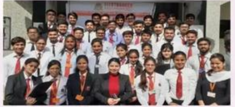
Recruitment Drive of Jaro Education