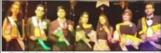
फ्रेशर पार्टी में तुम्हारे दो साथी निकलेंगे फ्रेशर पार्टी।