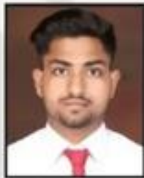
Ramji Singh Shriram General Insurance Co. Ltd.