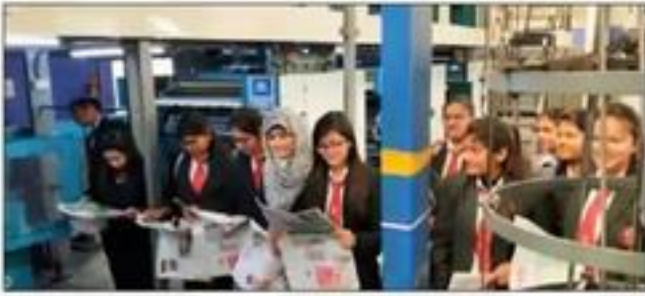
Industrial Visit - Dainik Jagran