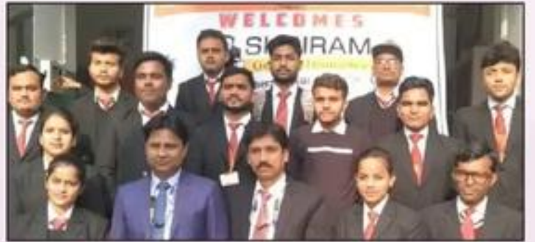
Recruitment Drive of Shriram General Insurance Co. Ltd.