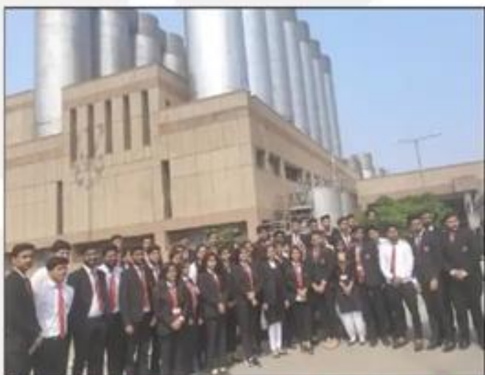
Industrial Visit to AMUL Dairy, Faridabad