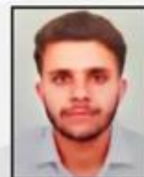
Aviral Chahal Wealth Clinic Pvt. Ltd.