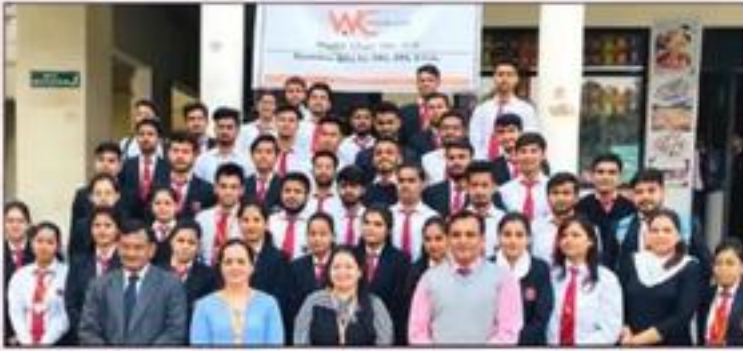
Recruitment Drive of Wealth Clinic Pvt. Ltd.