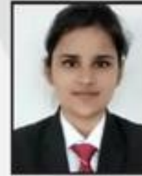
Upasna Chaudhary Fortis Hospital