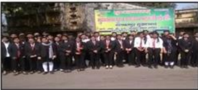
Industrial Visit to Parag Dairy