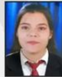
Yogita Sachdeva Wealth Clinic Pvt. Ltd.