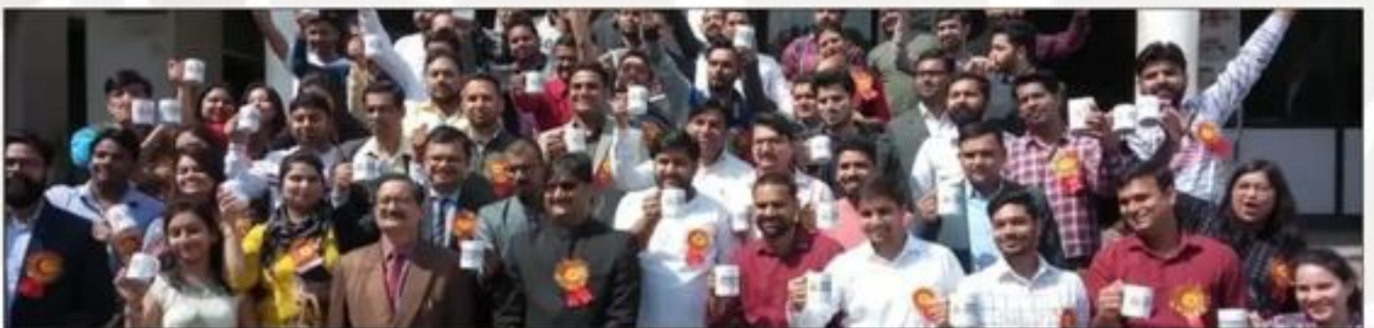
Alumni Meet & Holi Milan