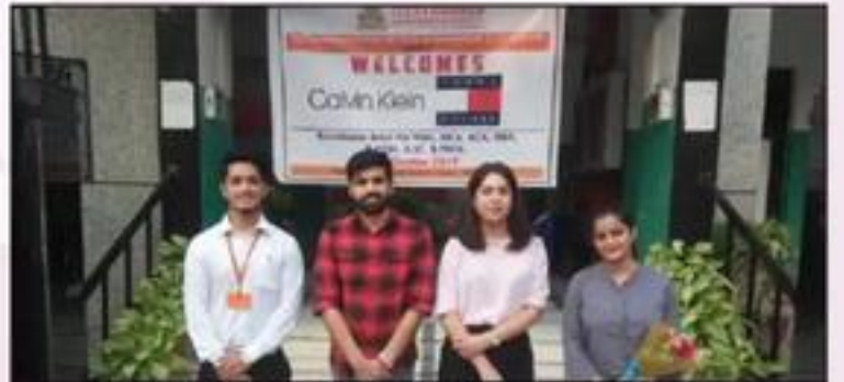
Recruitment Drive of Tommy Hilfinger / Calvin Klein