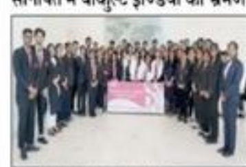
सोनीपत में याकुल्ट इण्डिया का भ्रमण करने पहुंचे टिमिट के छात्र।

सोनीपत में याकुल्ट इण्डिया का भ्रमण करने पहुंचे टिमिट के छात्र। सोनीपत में याकुल्ट इण्डिया का भ्रमण करने पहुंचे टिमिट के छात्र। सोनीपत में याकुल्ट इण्डिया का भ्रमण करने पहुंचे टिमिट के छात्र।