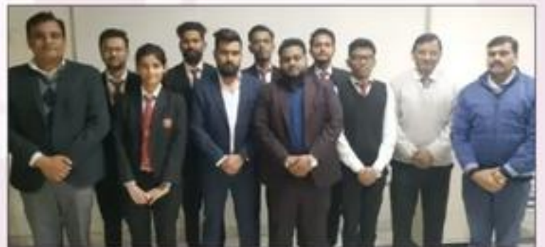
Recruitment Drive of Investors Clinic Infratech Pvt. Ltd.