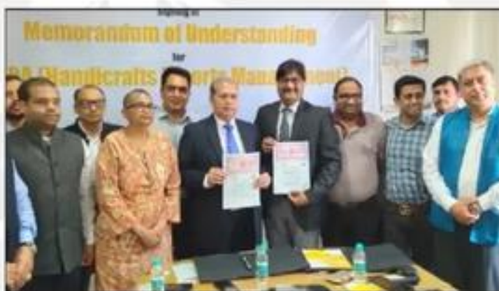
Signing of MoU for MBA (Handicrafts Export Management) with TMIMT, TMU & EPCH