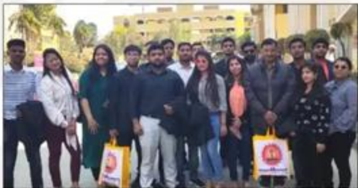
Industrial Visit to Entrepreneurial Cell DSV Haridwar & Patanjali Yougpeeth Roorkee