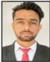
Sahib Singh Wealth Clinic Pvt. Ltd.