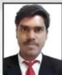
Hariharan D. M.R. Granites