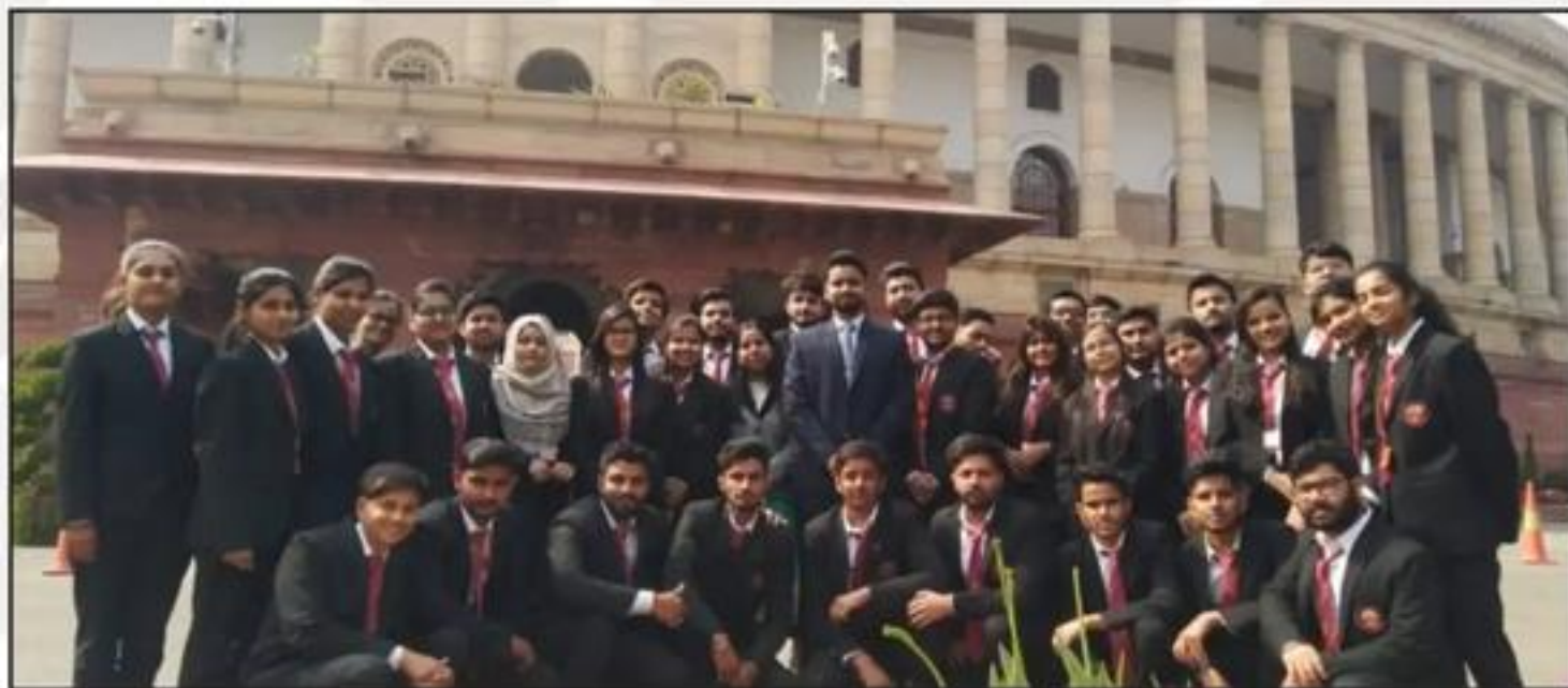
Educational Visit to Parliament of India