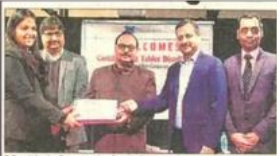
टिमिट में टेबलेट डिवाइस करते एबीएम सिटी।