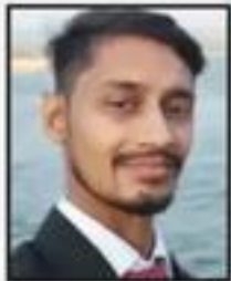
Bhavesh Surana Aditya Construction