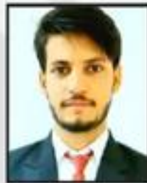
Rajat Pal Wealth Clinic Pvt. Ltd.