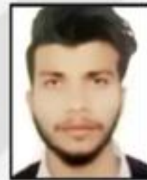
Shah Faid Shriram General Insurance Co. Ltd.