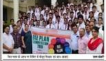
बिज प्लान कार्यक्रम में भाग ले रहे छात्र।

(आर.के.सिंह) मुद्रादाबाद: टिमिट में बिज प्लान कार्यक्रम का आयोजन हुआ। कार्यक्रम में डॉ. विकास श्रीवास्तव ने प्रकृति के बचाव की खातिर सीमेंट का विकास संकलने की जरूरत पर बात किया।