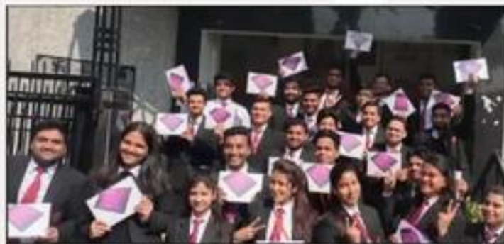
Laptop Distribution Ceremony