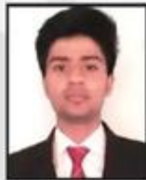
Ajharuddin Wealth Clinic Pvt. Ltd.